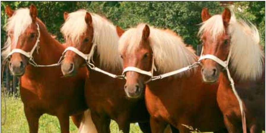
Shetland-Stuten der Familie Ronny und Ute Dietrich, Chemnitz-Klaffenbach

Trockenschnitzel enthalten hochverdauliche Pektine und im geringen Umfang Zucker. Sie werden gern von den Pferden aufgenommen. Wegen des Quellvermögens und des damit einhergehenden Risikos von Schlundverstopfungen und/oder Koliken sollten Trockenschnitzel nur in beschränktem Umfang eingesetzt werden. Vor dem Verfüttern müssen sie in Wasser eingeweicht werden.